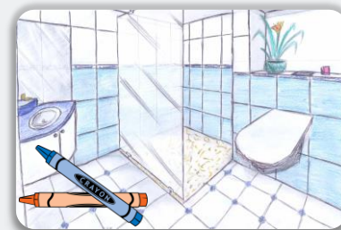
Dessin réalisé par un stagiaire

Le formateur, architecte d'intérieur, guide le groupe et lui apporte son expérience